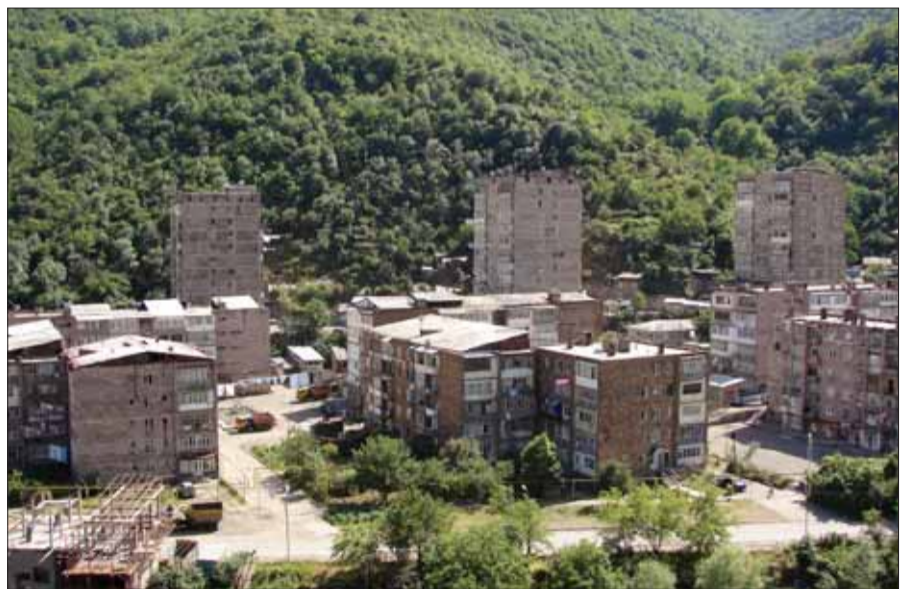
Կապանի Հավիձոր եւ Երկաթուղայինների թաղամասերը, որոնք կառուցվել են Վ.Աբրահամյանի ղեկավարությամբ